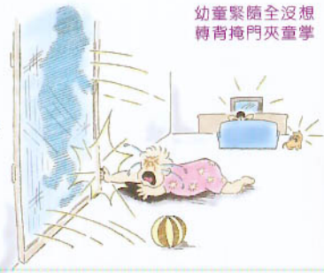
幼童緊隨全沒想 轉背掩門夾童掌